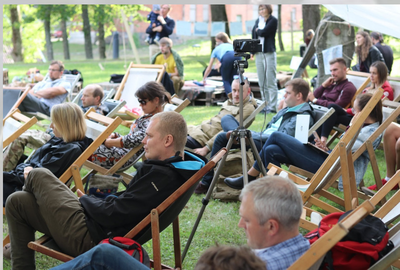
Arvamusfestivali Hea Kliima ala.

Hea kliima ala arutelusid saab järele vaadata Eestimaa Looduse Fondi Youtube'i lehel .