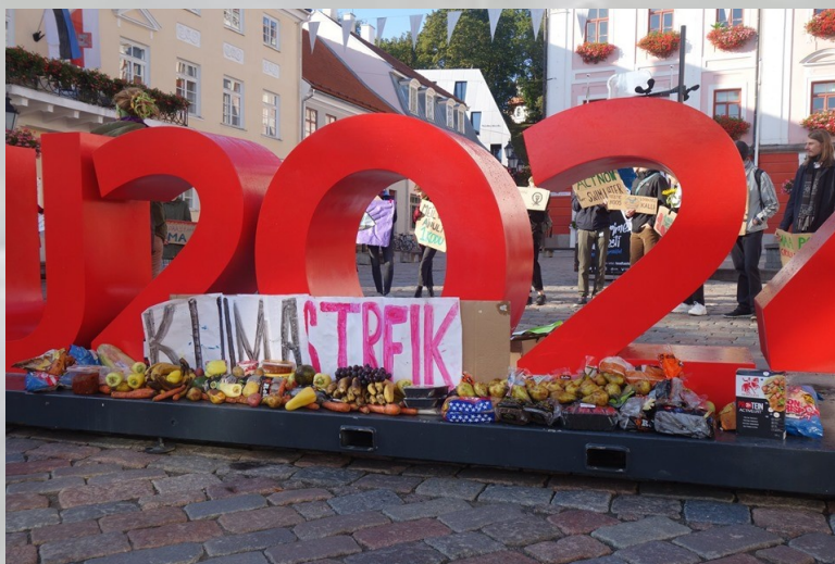
Kliimastreik 20. septembril Tartus

Kui kliima ja keskkond on südamelähedased, siis on kliimastreigid erakordne võimalus kuulata ja jagada mõtteid inimestega, kes tunnevad ja mõtlevad samamoodi. Näha enda ees rahvamassi, kes samuti saab aru, kui tõsine on olukord, ning tunda, et sa pole oma mures ükski — see annab lootust ja tugeva emotsiooni, mille abil jälle edasi minna. Meie meelevaldused toimuvad üsna vabas vormis ja keegi pole kohustatud terve aja kohal olema või plakatiga vehkima. Ka tagasihoidlikum inimene saab osa võtta ja soovi korral tagareas kõnesid kuulata. Meelevaldused on kõik rangelt rahumeelsed ja siimaani olnud ka täiesti seaduslikud, seega karta pole midagi, võita aga palju rohkem.