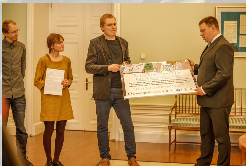
Allkirjade üleandmine enne valitsuse kliima- ja energiakomisjoni istungit 30. septembril.

Arvamusfestivali raames lükkasime üheskoos Eestimaa Looduse Fondi ja Keskkonnaõiguse Keskusega käima Eesti kliimasõbralikule tulevikule suunatud rahvaalgatuse . Sellega soovisime Eesti riigilt kiiret tegevust kliimamuutuse pidurdamiseks: Eesti peab saavutama kliimanetraalsuse hiljemalt 2035. aastaks teaduspõhiste ja kogu ühiskonda kaasavate õiglaste lahenduste kaudu. 30. septembril andsime algatusele kogutud 2848 allkirja üle peaminister Jüri Ratasele