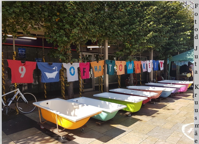
Vannid sümboliseerivad veekulu rõivatööstuses. Londoni Moenädala vastane üritus selle aasta septembris.

Protestiteooria ütleb, et inimesed liituvad liikumisega, kui nad ei saa ilma (nt mustanahaliste vastupanuliikumine USAs), või kui seal on juba ees piisavalt palju inimesi. XR on masside meelitamisega küll hästi teinud, nii et enamgi veel liituvad. Nii on neil ka suurem kõlapind keskkonnakaitse sõnumite edastamisel.