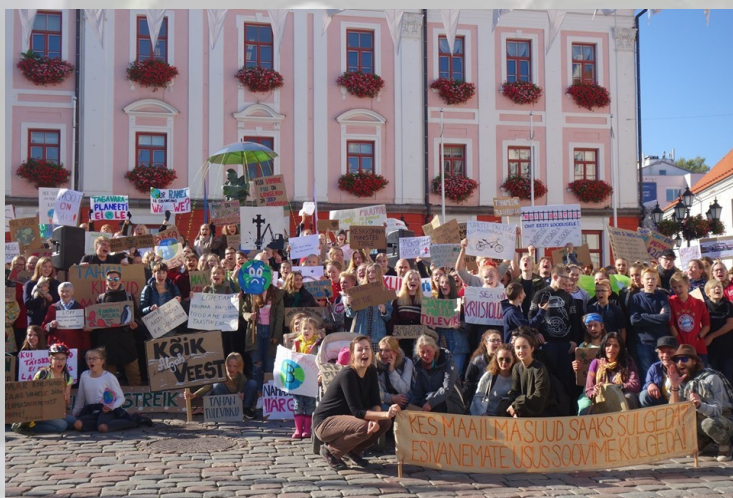
Kliimastreik 27. septembril Tartus