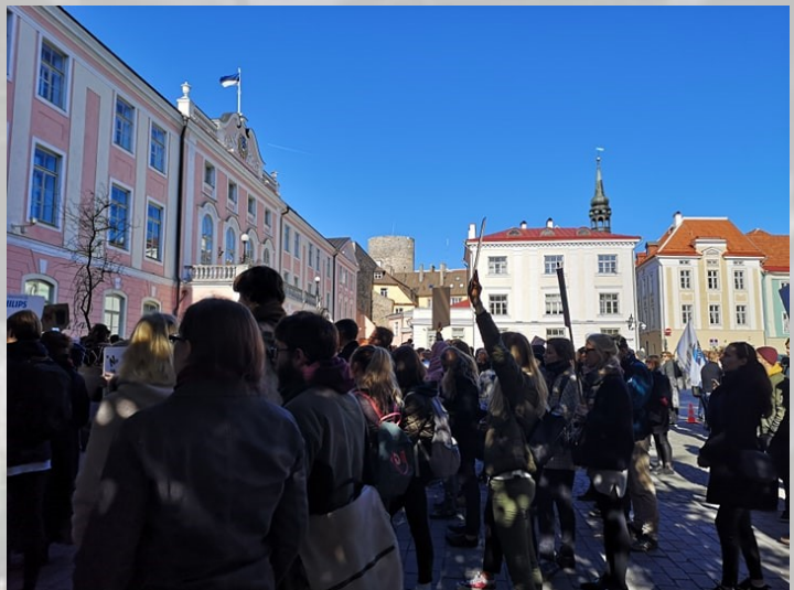
27. septembri kliimastreik Tallinnas

Saavutushetki on olnud mitmeid, mõned neist on olnud seoses streigi korraldamisega, teised jälle tundega, et meid on kuulda võetud. Esimene eriline hetk minu jaoks oli 15. märtsi meeleavaldus, kui ma nägin, kui palju eri vanusest ja eri elualadelt inimesi oli kohale tulnud ning õhtul kajastas streiki ka "Aktuaalne kaamera" oma põhiuudistes. Alates sellest hetkest hakkas käima aktiivsem avalik diskussioon kliima teemadel, meid kutsuti intervjuudele ja saadettesse ning järjest enam kirjutati sel teemal artikleid ja arvamslugusid. Oluline hetk oli ka president Kersti Kaljulaidi toetus, kui ta mainis kliimastreike oma kõnedes ja rõhutas mitmel korral kliimamuutusega võitlemise olulisust. Kohtumised presidendi ja peaministriga tähendasid, et olime suutnud viia oma sõnumi võimul olevate inimesteni. Saavutuseks loeksin ka seda, et oleme saanud tagasisidet näiteks keskkonnaministeriumi ametnikult, kelle sõnul meie tegevus aitab seal asju liikuma panna ning annab neilegi lootust juurde.