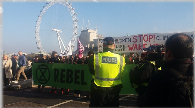
Viie silla blokaad Westminster'i sillal 2018. aasta novembris

Kritiseeritud on seda, kuidas paljud keskkonnakaitseliikumised, sealhulgas XR ei ole piisavalt kaasavad eri rahvusest inimeste hääle edasi kandmisel ja ürituste korraldamistel.